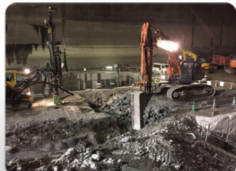
「かち割る君」の作業状況 1